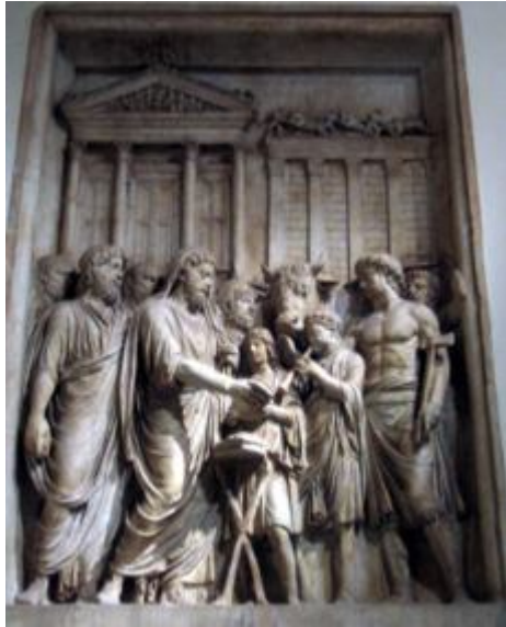
Gb 1. Relief Gambaran Qurban Kerajaan Lama

Marcus Aurelius dan anggota-anggota keluarga Kerajaan mempersembahkan qurban sebagai pengucapan syukur atas keberhasilan melawan suku-suku Jermanik: bas-reliefkontemporer, Museum Capitoline, Roma ( www.wikipedia.org )